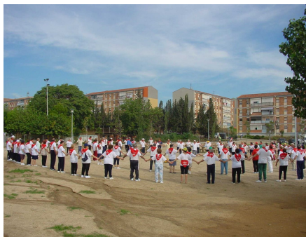
Sant Boi de Llobregat