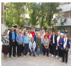
El Prat de Llobregat