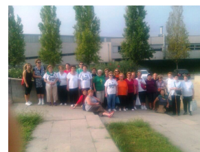
Molins de Rei