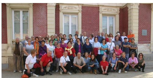
Esplugues de Llobregat