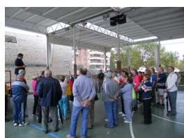
Corbera de Llobregat