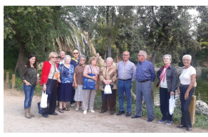
Sant Just Desvern