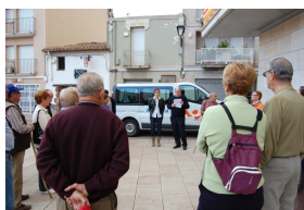
Castellví de Rosanes