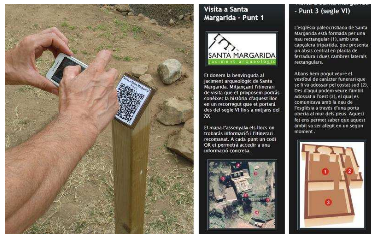
Figura 4. Suport de codi QR instal·lat a Santa Margarida, pantalla inicial de la visita i exemple d'una de les que es mostren al punt 3.

Entenem que és imprescindible que els centres d'estudis juguem aquest paper en la difusió de la cultura, sense cap temor a les possibilitats que ens ofereixen les tecnologies que, alhora, esdevenen