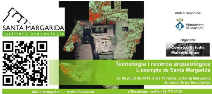
Figura 5. Invitació a la jornada de portes obertes a Santa Margarida 2011, amb el codi QR del web del CEM ( www.infocem.net )

mantenir, sinó en multiplicar els canals de comunicació i els registres utilitzats, prestant una millor atenció a la segmentació dels nostres públics i a l'elaboració de discursos més adequats per a cadascun d'ells. Mai difondre el coneixement havia estat tan al nostre abast, fins hi tot més enllà del que fins fa poc ens havia semblat la gran revolució: els llocs web.