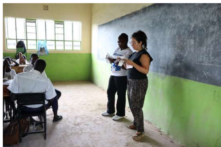
La Roser fent una sessió d'artteràpia a una escola local