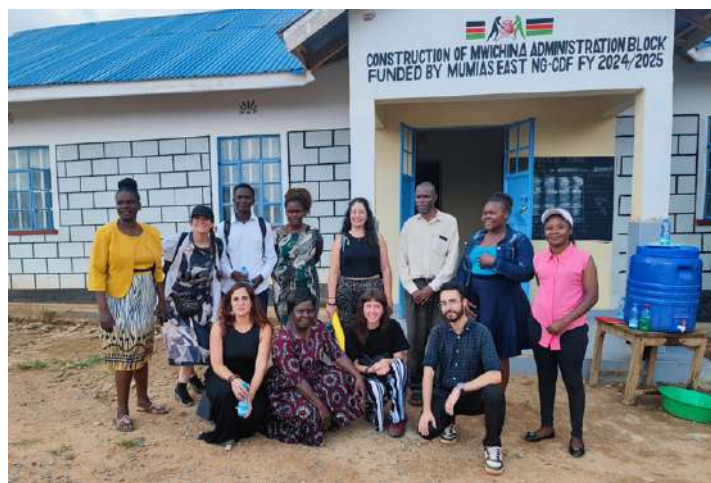
El grup de voluntàries europees a Shianda

L'idioma i la barrera cultural han estat un gran repte, igual que les expectatives de la comunitat. Tot això fa difícil oferir sessions significatives en un context canviant i inestable.