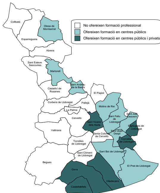
Mapa 1. Localització de la Formació Professional al Baix Llobregat. Curs 2014-2015.

Font: OC-BL a partir de les dades del Departament d'Ensenyament de la Generalitat de Catalunya